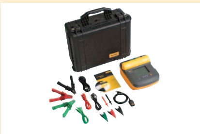
Juego medidor de aislamiento Fluke 1555