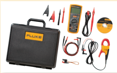
Juego avanzado para mantenimiento eléctrico Fluke 1587 FC ET