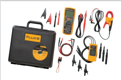
Juego avanzado para mantenimiento de motores y variadores de velocidad MDT